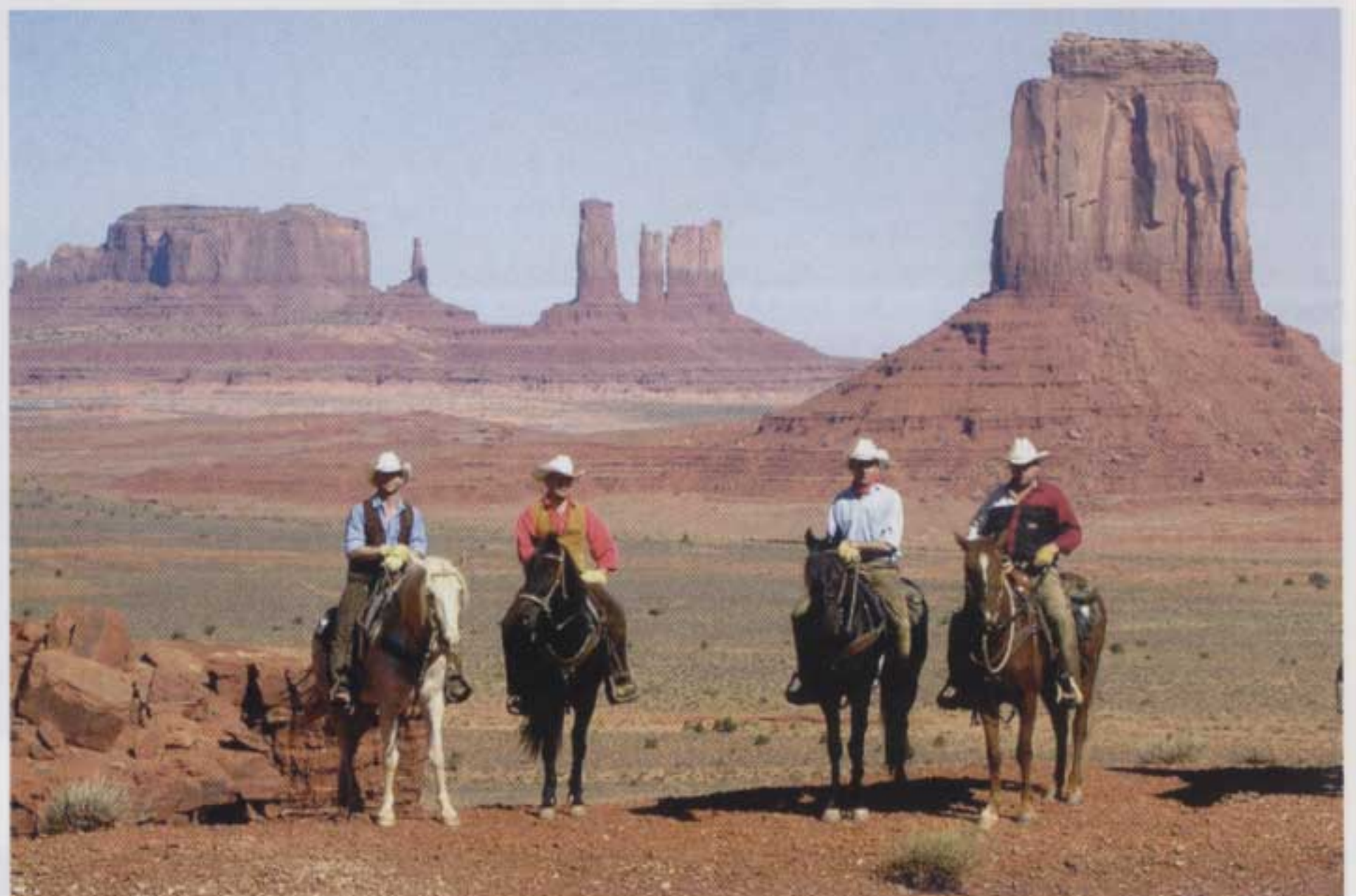
Monument Valley - „Marlboro Country“

1938 wurde das Valley von Hollywood entdeckt, und mit „Stagecoach“ begann ein neues Zeitalter im Valley. Viele Westernfilme wurden hier gedreht und ein junger Schauspieler, John Wayne, betrat dabei die Leinwandszene.